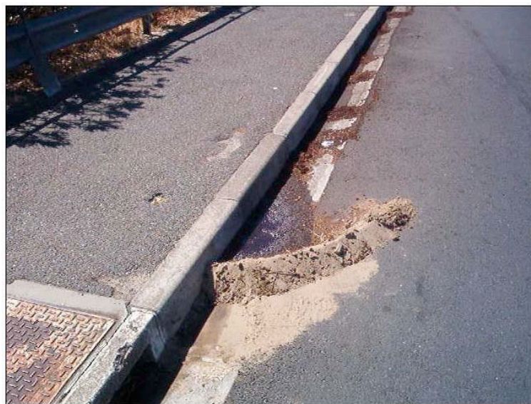
Frenando el vertido en pendiente.