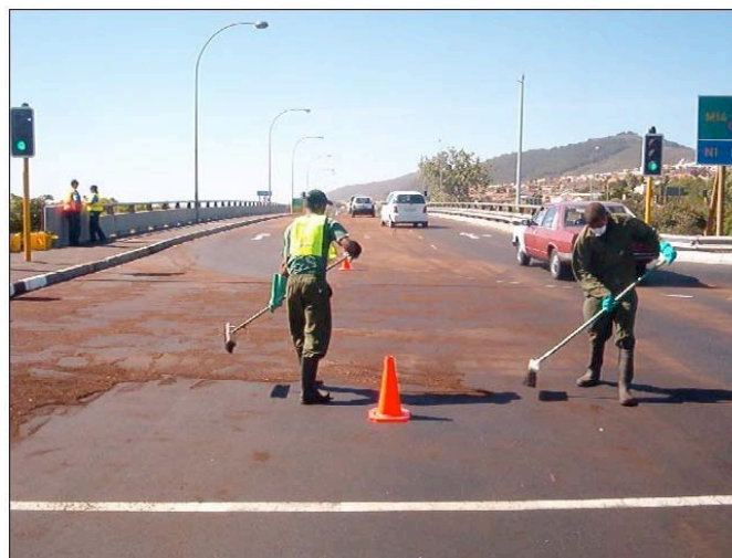
Retirando primera capa de TURBAMAX.