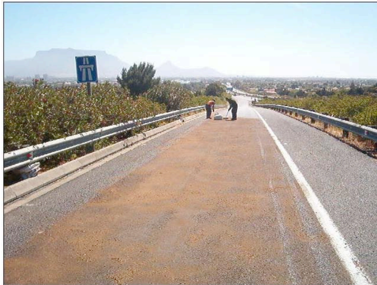
Echando la última mano de TURBAMAX.