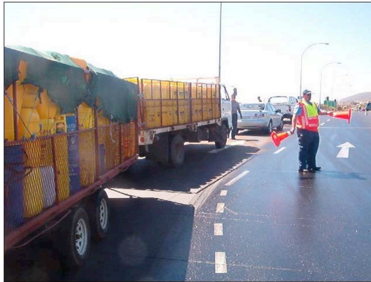
Superficie afectada de diesel en la carretera

-Respuesta de Emergencia: Limpieza de Diesel. Evitar accidentes de trafico, Minimizar operaciones de limpieza/recogida (menor volumen) así como de tiempo/costes; Minimizar el impacto medioambiental.