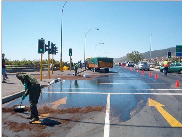
Empezando as labores de absorción.